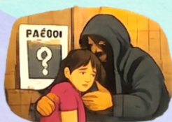
Desaparición por particulares