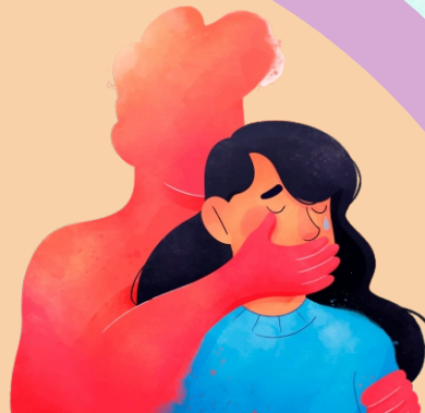
FASE 2: Explotación o agresión (golpes, insultos grave, violencia física o sexual)