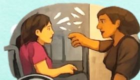
Violencia contra las mujeres con discapacidad