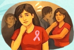
Violencia contra mujeres con virus de inmunodeficiencia humana