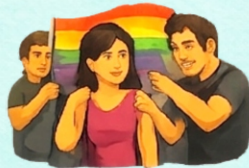
Violencia por orientación sexual