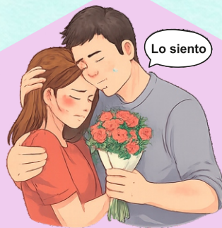
FASE 3 Luna de miel o reconciliación (Agresor pide perdón, llora, promete cambiar y regala cosas)