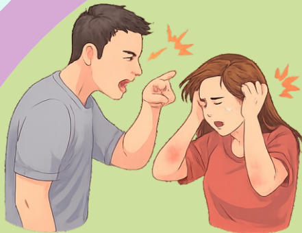
FASE 1: Acumulación de Tensión. (Insultos, gritos, control del dinero y amistades)

Salir de una relación violenta no es una decisión simple; es un proceso sumamente complejo debido a que la violencia opera en un entramado repetitivo que atrapa psicológicamente a la mujer. Este círculo tiene tres fases que se repiten una y otra vez: