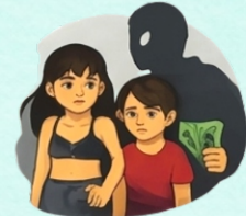
Explotación sexual de niñas, niños y adolescentes