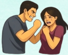
Violencia en relación de pareja

Las modalidades de la violencia comprenden las diversas formas en que esta se expresa en distintos ámbitos y contextos sociales, afectando de manera diferenciada a las víctimas según sus condiciones y situaciones particulares. Estas modalidades incluyen aquellas que se manifiestan a través de: