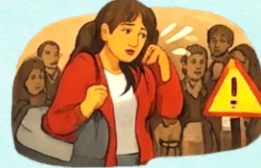
Violencia contra mujeres afroperuanas