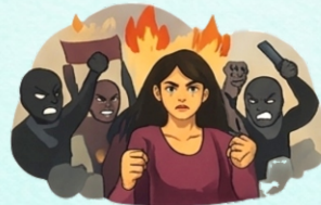
Violencia en conflictos sociales