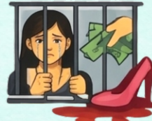
Trata de personas con fines de explotación sexual