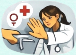
Violencia en los servicios de salud sexual y reproductiva