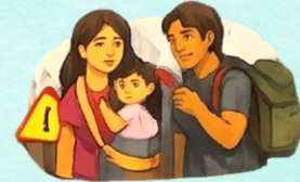
Violencia contra mujeres migrantes