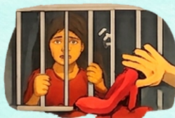
violencia en mujeres privadas de libertad