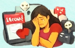
Violencia facilitada por las tecnologías digitales