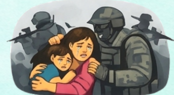
Violencia en conflicto armado