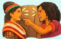
Violencia contra mujeres indígenas u originarias