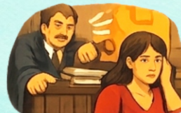
Acoso a través del proceso judicial